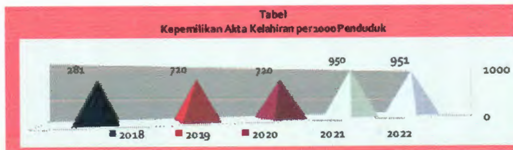
Sumber data : Dinas Kependudukan dan Pencatatan Sipil

Berdasarkan grafik tersebut diatas, memperlihatkan bahwa kepemilikan akta mengalami peningkatan yang cukup signifikan.