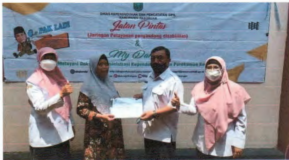
Pelayanan 'MY DARLING' Penerbitan Akta Kelahiran