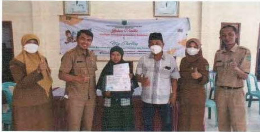
Pelayanan KIOS E-PAK LADI Penerbitan Kartu Keluarga