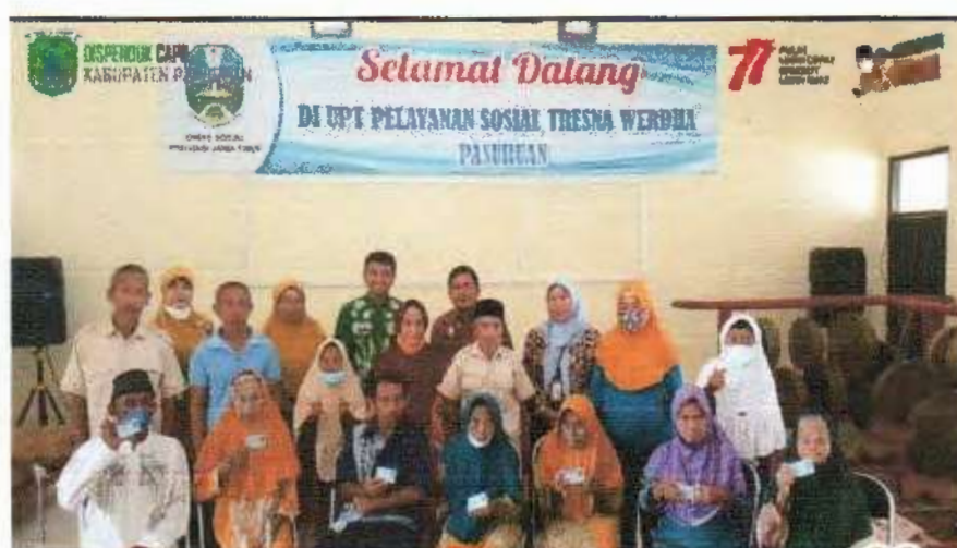
Pelayanan "SI MANIS DUDUK MANJA" Penerbitan E-KTP

Berdasarkan tabel tersebut di atas, terlihat bahwa prosentase kepemilikan KTP di Kabupaten Pasuruan dari tahun 2022 mengalami peningkatan apabila dibandingkan dengan tahun tahun sebelumnya. Sebelumnya pada tahun 2021 jumlah penduduk yang memiliki KTP sebesar atau 99,14 % dari target wajib KTP, hal ini dikarenakan meningkatnya kesadaran penduduk untuk memiliki KTP, untuk selengkapnya dapat dilihat pada grafik berikut ini :